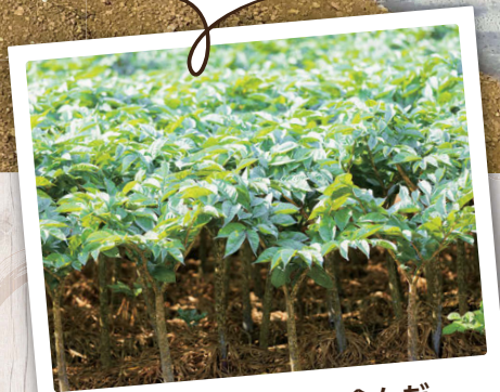
植物由来原材料を含んだ 配合を採用しています。