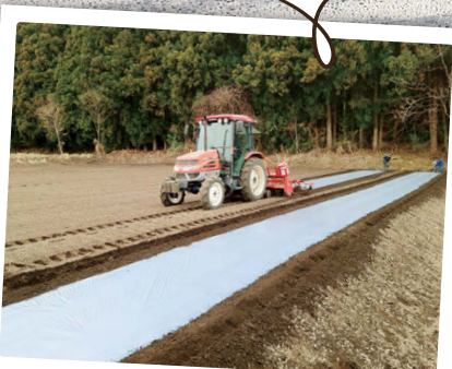
強度・柔軟性があり 機械展張が可能です。