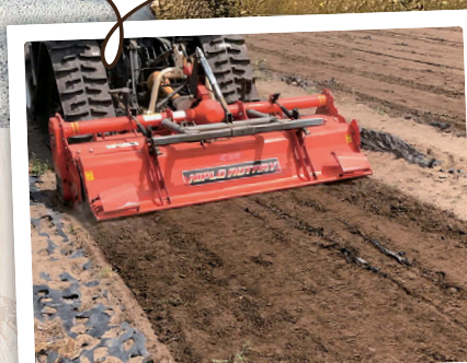
使用後はしっかりとすき込むことで 土中で分解し廃プラ削減になります。