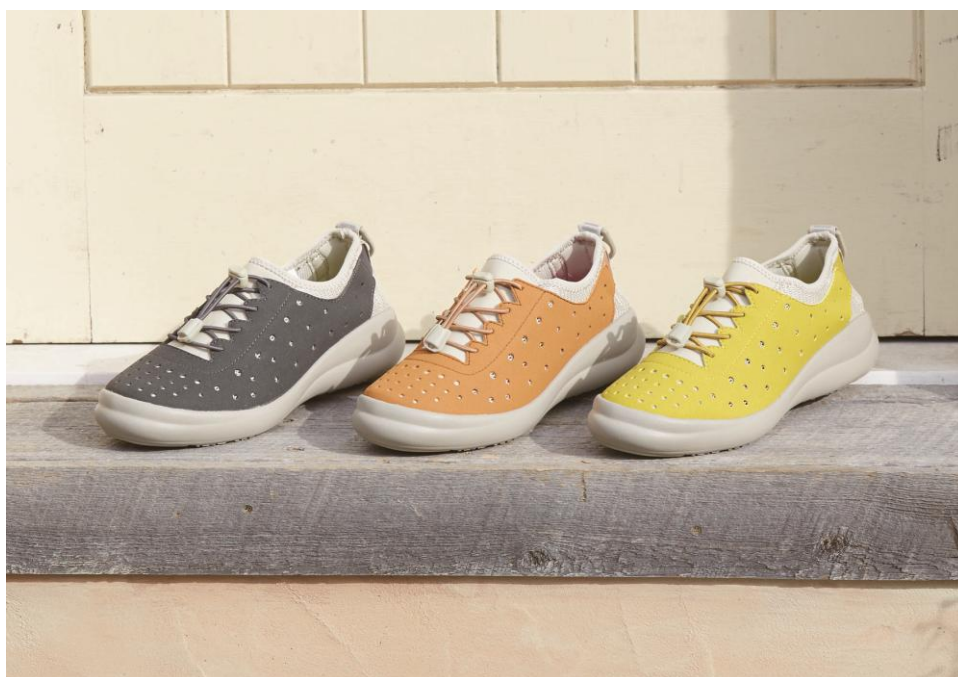
「フォートゥースリーデザインズ」2017年春夏新商品

【商品名】「CUD 0430」【色】チャコール(左)、オレンジ(中央)、イエロー(右)【価格】9,800+税【サイズ】22.0~25.0cm