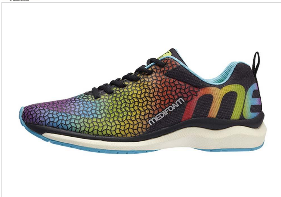
ランニングシューズ「MEDIFOAM」2017年秋冬モデル

【商品名、色】MFR 1030、Rainbow Color 【価格】9,800円+税 【サイズ】23.0～29.0cm