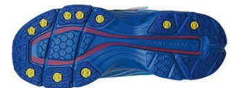
ダッシュスパイク（黄色部）と縦溝意匠（赤色部）