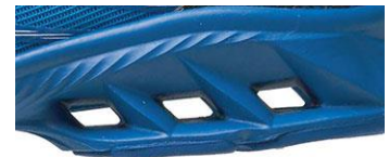
新ストームホール

ラインアップは1タイプ3カラーで、足当たりのよいシームレスのアップパー（甲）は“空力RUN”を印象付ける躍動感あふれるデザインです。心おどるような機能と外観のカッコよさをポイントにし、小学生の楽しい毎日を足元から支えます。