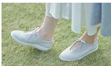
レザーシューズ『アキレス・ソルボ』

さっぽろ東急百貨店にオープンするポップアップショップは、『Achilles Lifestyle Store』で複数のカテゴリーにわたるブランドを集めて実施するポップアップショップとしては今回が全国初となります。東急プラザ渋谷の店舗と同じく、シューズ・寝具・フット&ヘルスケア・壁紙の4カテゴリーを中心に展開し、『Achilles Lifestyle Store』の魅力をそのままに、コロナ禍におけるライフスタイルの変化に寄り添った多彩な商品をお届けします。また、期間中は、商品の機能や快適さを体感いただけるイベントを毎週末に実施します。幅広いお客様に親しまれているさっぽろ東急百貨店への出店により、当社ブランドの認知拡大とイメージ向上を図るとともに、商品の魅力をより多くの方々へダイレクトに訴求していきます。