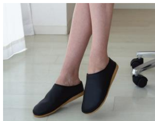
ルームシューズ『ソルボオフ』