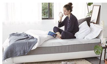
高機能寝具『フレアベル サーモフェーズ』