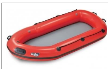
レスキューボート 「DEIB-310」