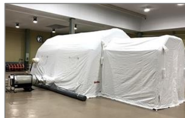
感染症対策用 陰・陽圧式 エアータント「NP-45」