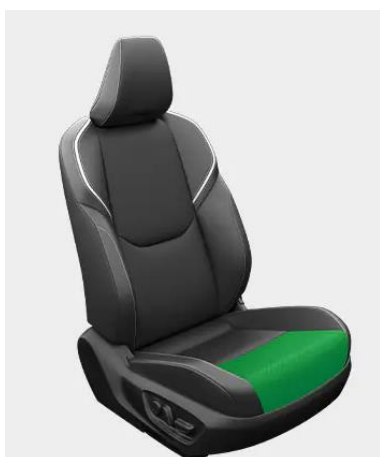
「導電性表皮材」使用部(緑色の部分)

運転席の一部に当社の「導電性表皮材」を使用し、除電機能を付加。ドライバーと周辺に溜まっている静電気を分散させて帯電量を軽減し、快適なドライビングに寄与します。