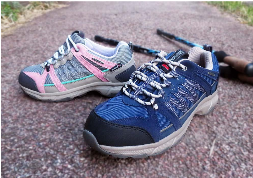
「SPALDING」2023年/ノルディックウォーキングシューズ