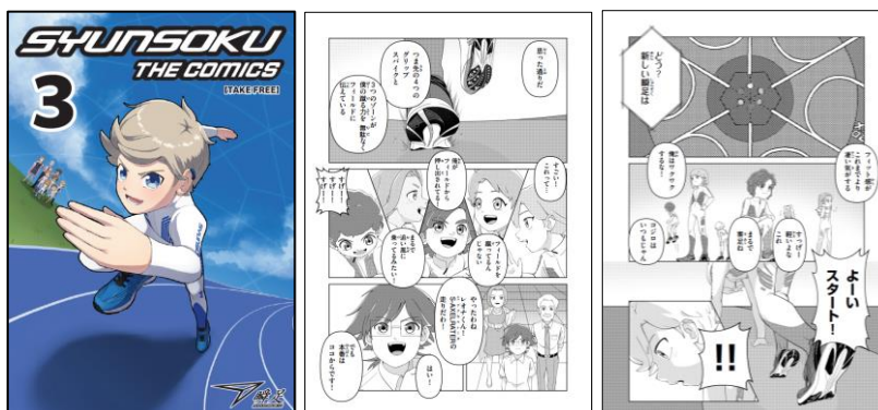
「SYUNSOKU THE COMICS」第3巻

「S-AXELRATER(エスアクセルレータ)」の発売に合わせ、瞬足オリジナルキャラクター「XDREAMERS(エクスドリーマーズ)」の新ビジュアルを展開、キャラクター制作は国内外に良質なアニメ作品を送り出す、株式会社A-1 Pictures(エイ・ワン ピクチャーズ)が担当しました。また、子どもたちをワクワクさせるオリジナルマンガ「SYUNSOKU THE COMICS」の第3巻、計5万部を全国の靴専門店にて無料配布いたします。作中では「XDREAMERS」の日常を描いており、子どもたちに走ることや瞬足を履くことのワクワク感を発信します。