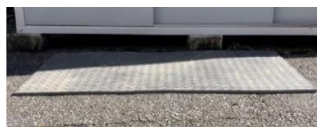
写真:(左)凹凸面で使用、(右)約 1 日で復元(自社試験)。

当社は生活資材や産業資材など、さまざまな分野で環境対応製品を開発・販売しています。今後よりリサイクルに取り組み、持続可能な社会の実現に貢献する製品の開発を進めていきます。