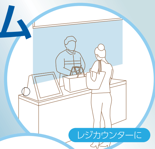
レジカウンターに