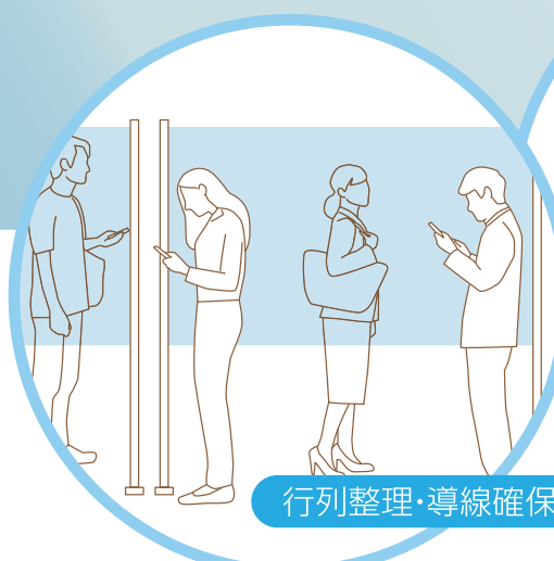
行列整理・導線確保に